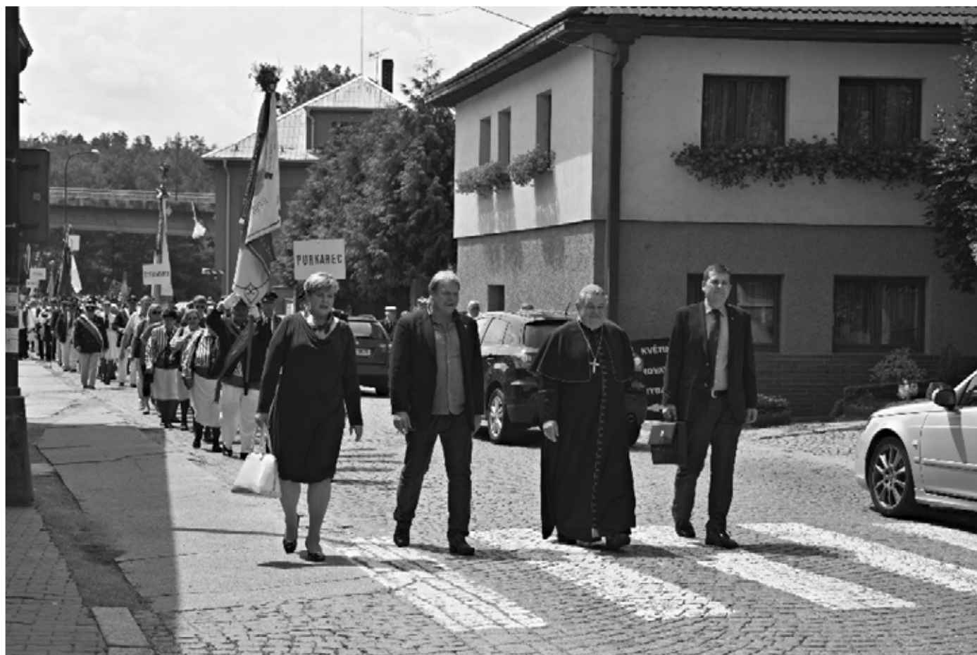
Slavnostní průvod městysem