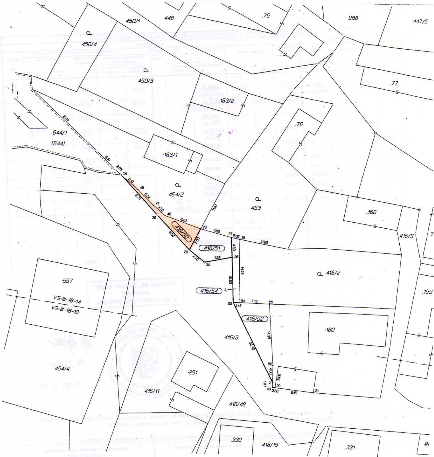
Seznam souřadnic (S-JTSK) Číslo bodu Souradnice pro zápis do KN