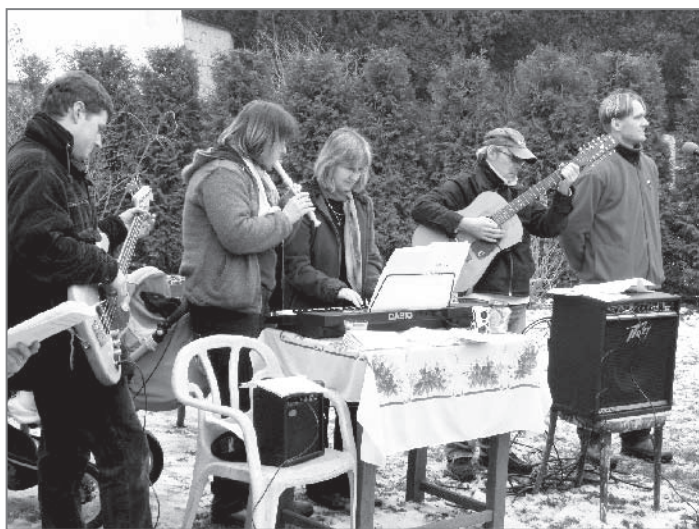
Pokojně vánoční svátky

Dovolil bych si na závěr udělat reklamu divadelnímu představení divadla MINOR „Vánoce aneb Příběh o narození“, které je pokusem o zamyšlení nad významem nejoblíbenějších svátků v roce. Charakter vyprávění zde vychází ze starých lidových vánočních her a evangelií. Představení navozuje tajuplnou atmosféru Vánoc; dávná biblická historie se tu odvíjí z obyčejného příběhu Josefa a Marie, světy nadpřirozené a všední se prolínají, aby na okamžik zachytily naději, utrpení, zlobu i radost. Tradiční vánoční příběh pro děti a rodiče je plný postav zlých, krutých, herodesovských, ale i laskavých, milých, andělských... Možná by bylo dobré místo hromadění dárků, unavování sebe sama běháním po obchodních domech a ponechávání potomků před televizními obrazovkami navštívit tohle divadelní představení. Na internetových stránkách www.zachrantejeziska.cz se může kdokoliv přidat k petici a zároveň je zde možnost zanechat vzkaz nebo přání pro Ježíška, nebo se podělit o zajímavé názory v diskusním fóru – některé úvahy jsou zde úsměvné, jiné stojí za zamyšlení.