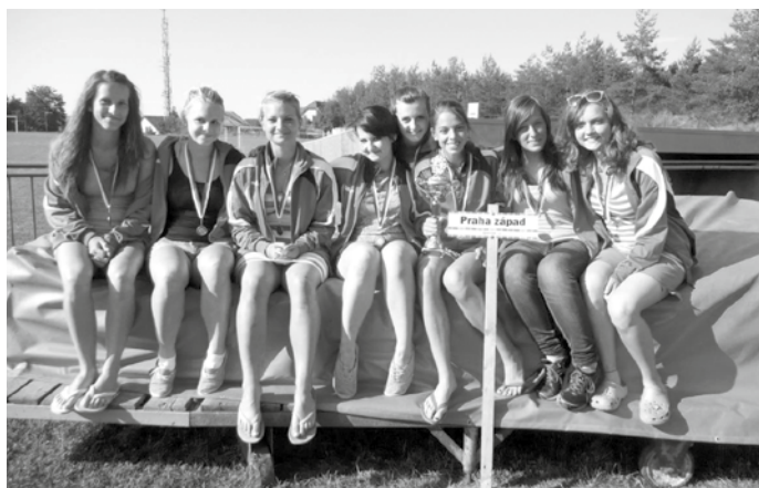
17. 6. 2012: Krajské kolo – dorostenky – Rakovník – 3. místo

Za slunného dopoledne jsme vyrazili za kamarády do Davle na oslavy založení sboru. Zde jsme se zúčastnili netypické soutěže a průvodu přes náměstí. V podvečerních hodinách jsme realizovali ukázkou moderního cvičení. Poté následovala volná zábava za doprovodu kapely GALAXIS, která vyvrcholila ohňostrojem.