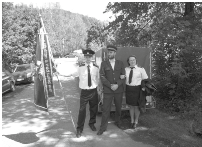
16. 6. 2012: Oslavy 125 let od založení SDH Davle