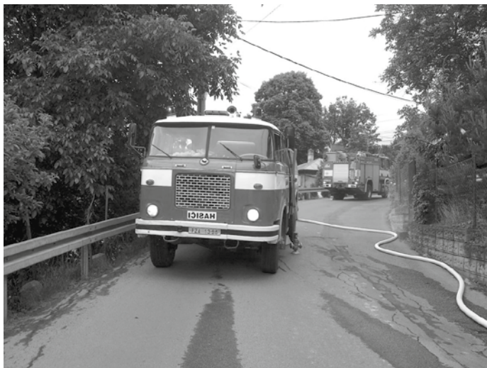
5. 6. 2012: Požár rodinného domu, Měchenice – Sloupecká

V červnu a v červenci jsme byli v jednom kole. Přiblížíme reportážní formou to nejdůležitější z naší činnosti.