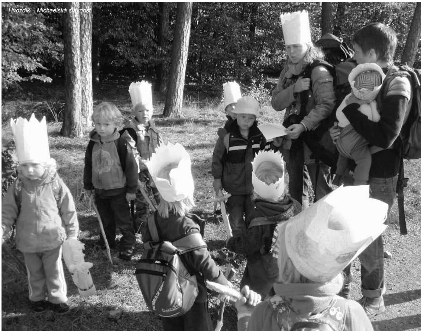
Hvozdík – Michaelská slavnost