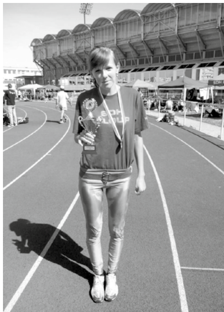
23. – 24. 6. 2012: Krajské kolo – ženy – Mladá Boleslav