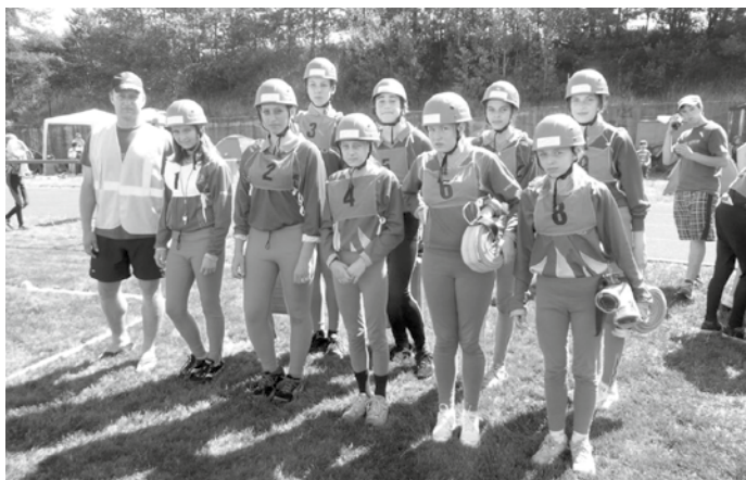
15. – 16. 6. 2012 Rakovník: Krajské kolo hry Plamen ročník 2011/2012

Po roce opět na krajském kole jsme byli všichni v očekávání, zda prodáme naši tvrdou přípravu na trénincích. Jak říkají nejzkušenější v týmu: „Připraveni jsme dobře, ale vždycky uděláme nějaké zbytečné chyby, a to se na kraji trestá.“ Tato věta se potvrdila a nám se nevyvedla dle našich představ ani jedna disciplína. 12 soutěžních družstev vítězů okresních kol středočeského kraje mezi sebou předvedlo vyrovnané výkony a přispělo k vysoké úrovni soutěže. Naši závodníci i po nevydařených výkonech nestrkali hlavu do písku, ale statečně bojovali do konce jako správný kolektiv. Celkově jsme skončili na 7. místě