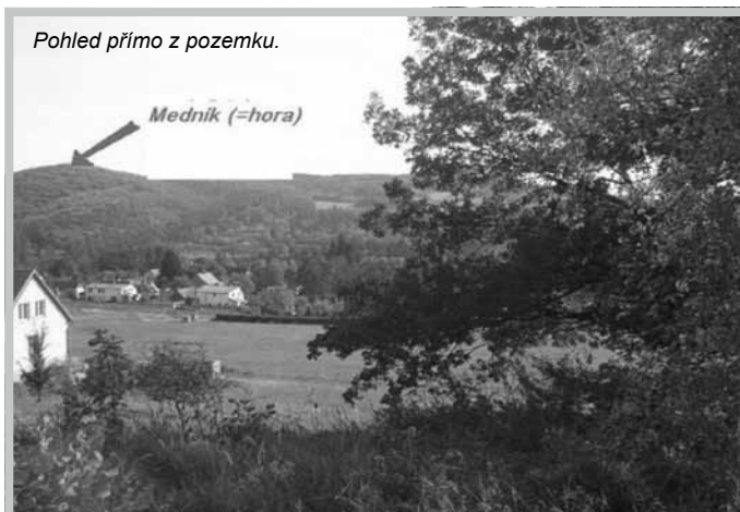
Pohled přímo z pozemku.