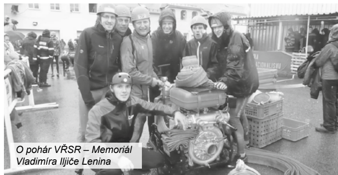
O pohár VŘSR – Memoriál Vladimíra Iljiče Lenina