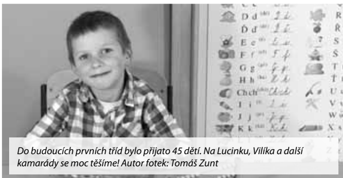
Do budoucích prvních tříd bylo přijato 45 dětí. Na Lucinku, Vilfka a další kamarády se moc těšíme!