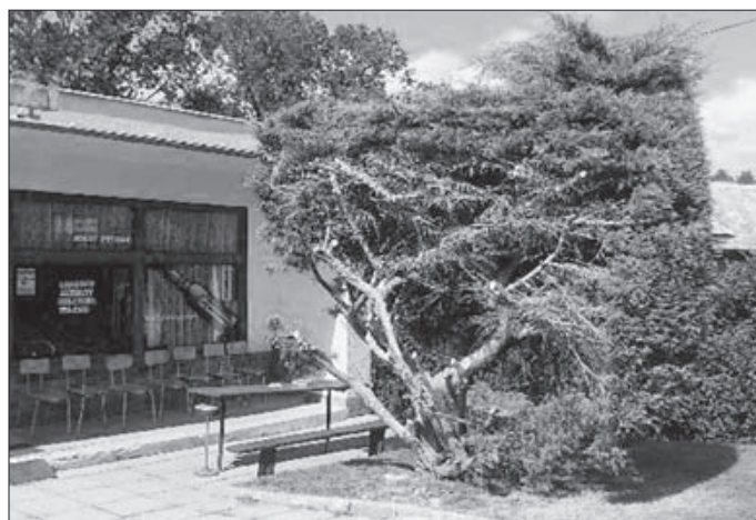
Nevhodně umístěný a na své místo již přerostlý jalovec – u potravin