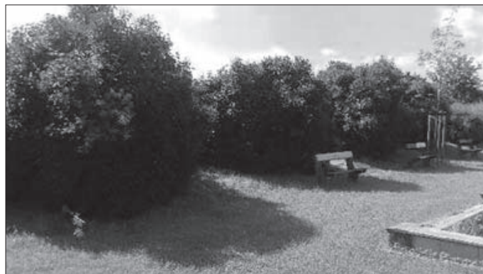
Šeříky mohou vyniknout celou svou krásou – na hřišti