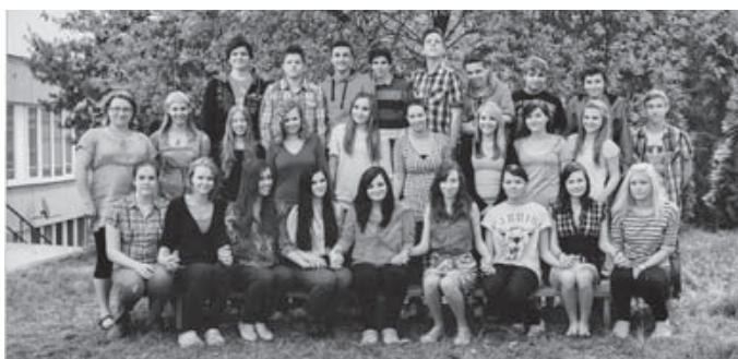
Základní škola Davle 2012 - 2013