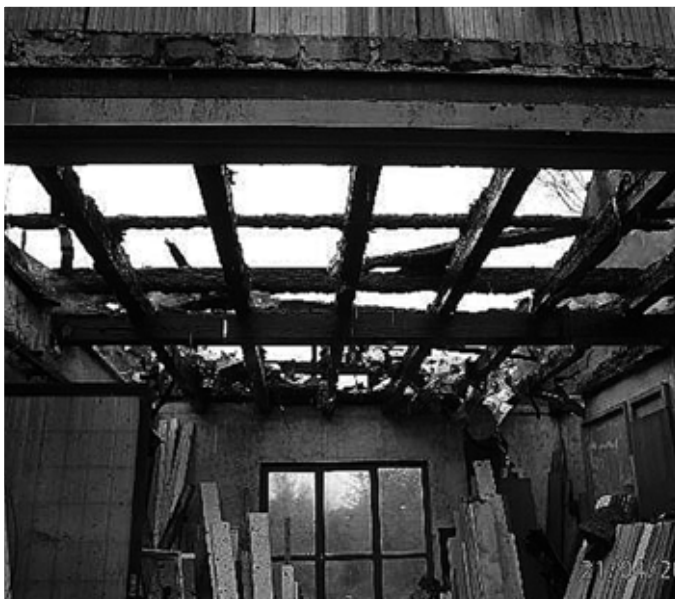
Požár truhlárny ve Hvozdnici

Jednotka sboru dobrovolných hasičů Městyse Davle se skládá ze dvou družstev – SDH Davle a SDH Sloup. K dnešnímu dni v jednotce slouží 23 členů (velitel jednotky, 5 velitelů družstva, 6 strojníků a 11 hasičů), kteří jsou připraveni v kteroukoli denní dobu vyjet k zásahu.