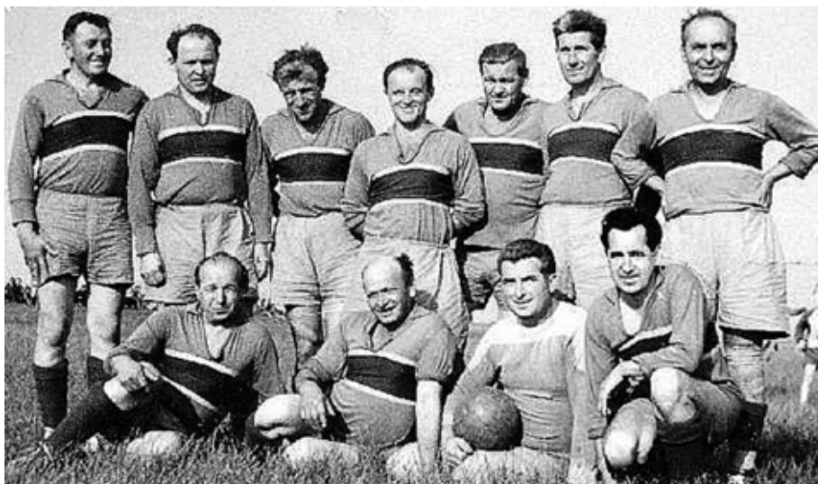
Fotbalová stará garda – kdo stojí na obrázku zcela vpravo?