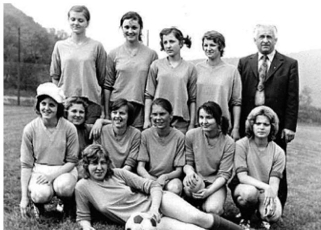
Fotografie fotbalového „ženstva“ z roku 1974

Městys Davle chce v jubilejním roce připomenout více i méně významné události, sportovní úspěchy i neúspěchy vydáním drobné brožury, jejíž titul bude stejný jako název tohoto článku. Titul je