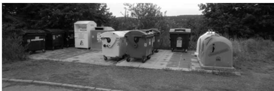
Nově upravené stanoviště kontejnerů na Sídlišti, kde je kompletní nabídka možnosti třídění.