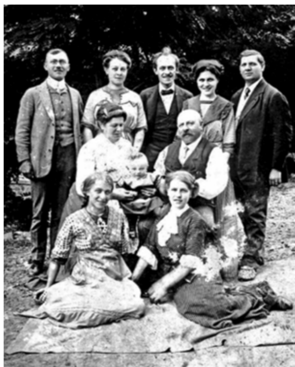
Vančurova rodina v Davli

dislav několik svých velkých lásek. První jeho láskou byl tatínek, kterého Vladislav velmi miloval. Vančura o lásce řekl: „Ve věcech lásky neplatí spořivost a nic vám nevynese na úročích, co jste dnes vložili do truhlice.“ 2